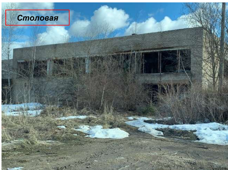
Фото объекта Лот №2